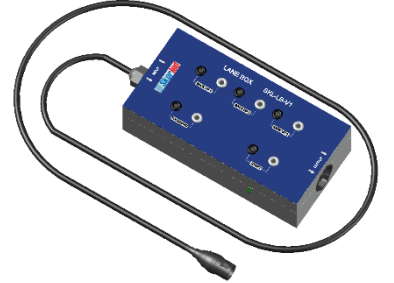
Kulvar Modülü (SKL – LB – V1)