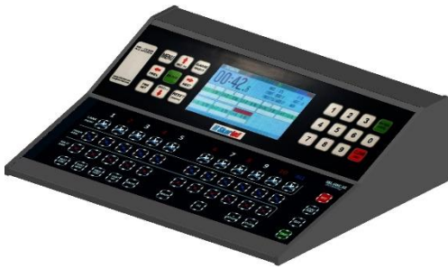
Yüzme Kumanda (Zamanlayıcı) (SKL – SWC – V2)