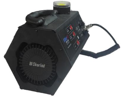
Start Cihazı (STR – 100)